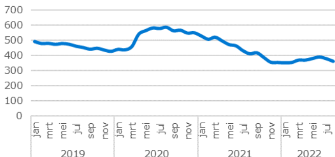
Afbeelding 2: Ontwikkeling WW-uitkering Klantcontactberoepen, Noord-Brabant